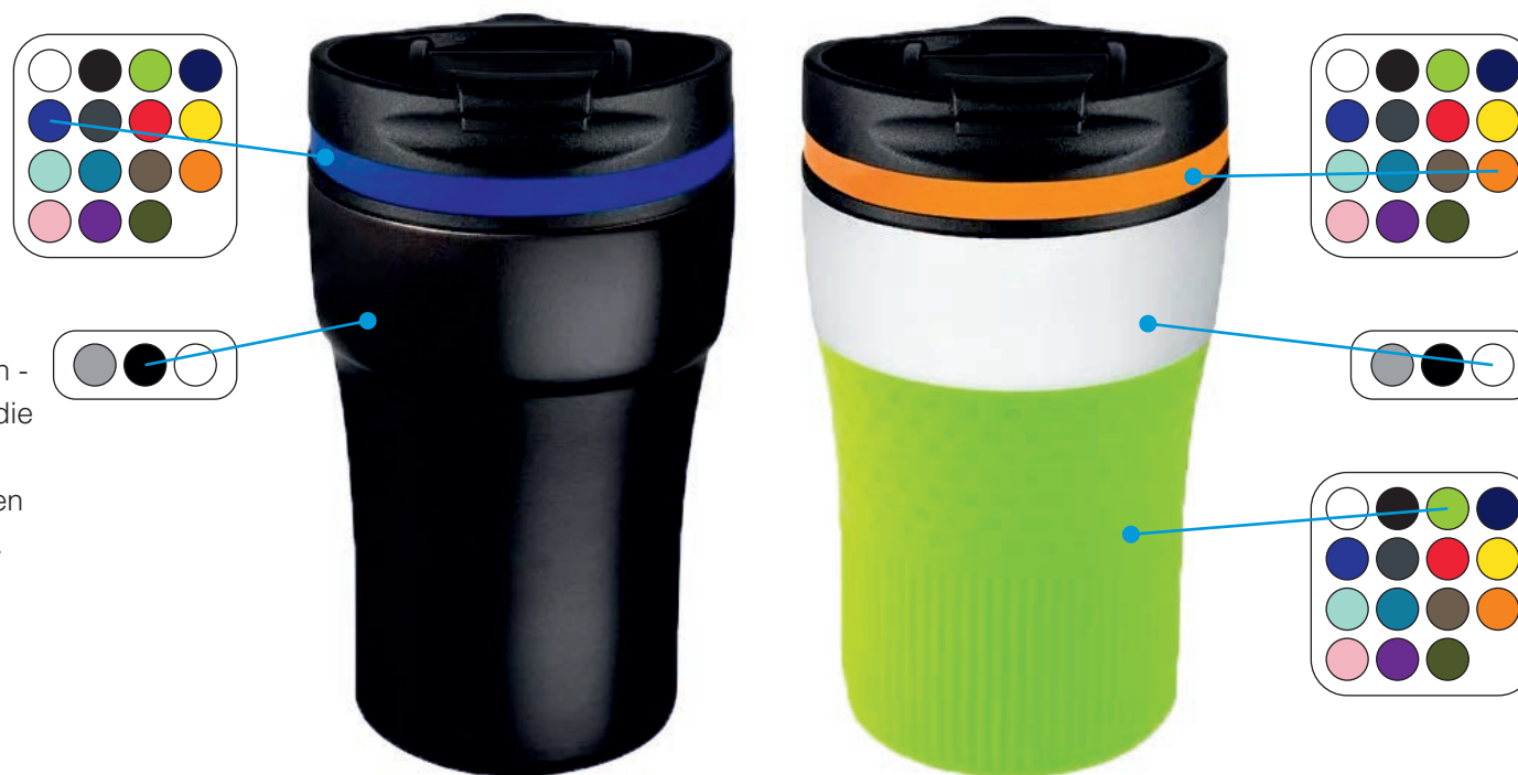
Ohne farbigem Sleeve

Fassungsvermögen: 230 ml 5252-17 (ohne Sleeve) 5253-17 (mit Sleeve, Aufpreis € 1,20)